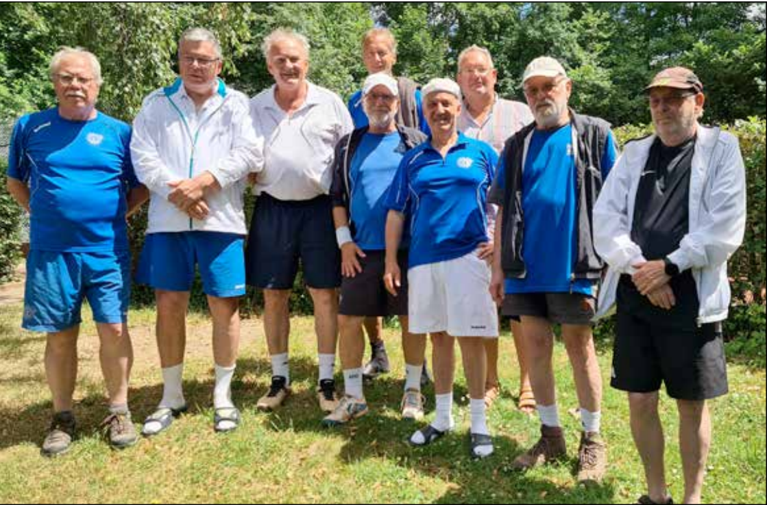
Unsere Herren 60 beim Heimspiel gegen den Werdener Turnerbund. Endstand 5:4 für den PSV.