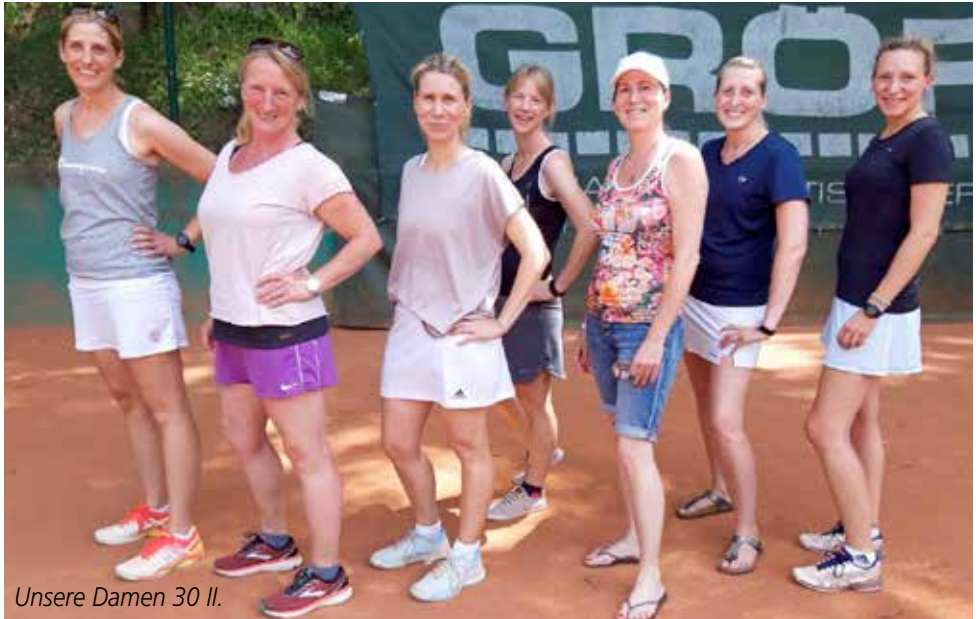
Unsere Damen 30 II.