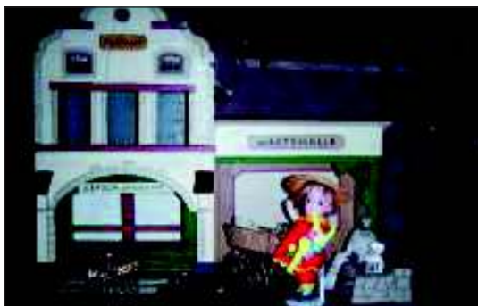
Postamt von Ernst Moritz Gottschalk, um 1920