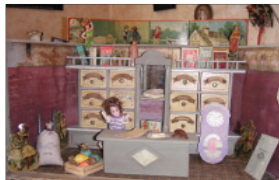
Antiker Kaufladen von Ernst Moritz Gottschalk um 1900.