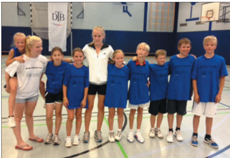
DTB-Talent-Cup 2013 inkl. Riegenführerinnen.

Mit 38 Punkten holte sich Hessen den Gesamtsieg der Talentiade. Auf dem zweiten Platz folgte Bayern mit 32 Punkten und dem Team vom TVN mit 31 Punkten. Die 9 Mädchen und Jungen vom NRW-Team haben mit einer guten Teamleistung und 24 Punkten den 12. Platz und damit das Vorjahresergebnis des TVN-Teams erreicht. Dabei erzielte nur eine der 16 Mann-