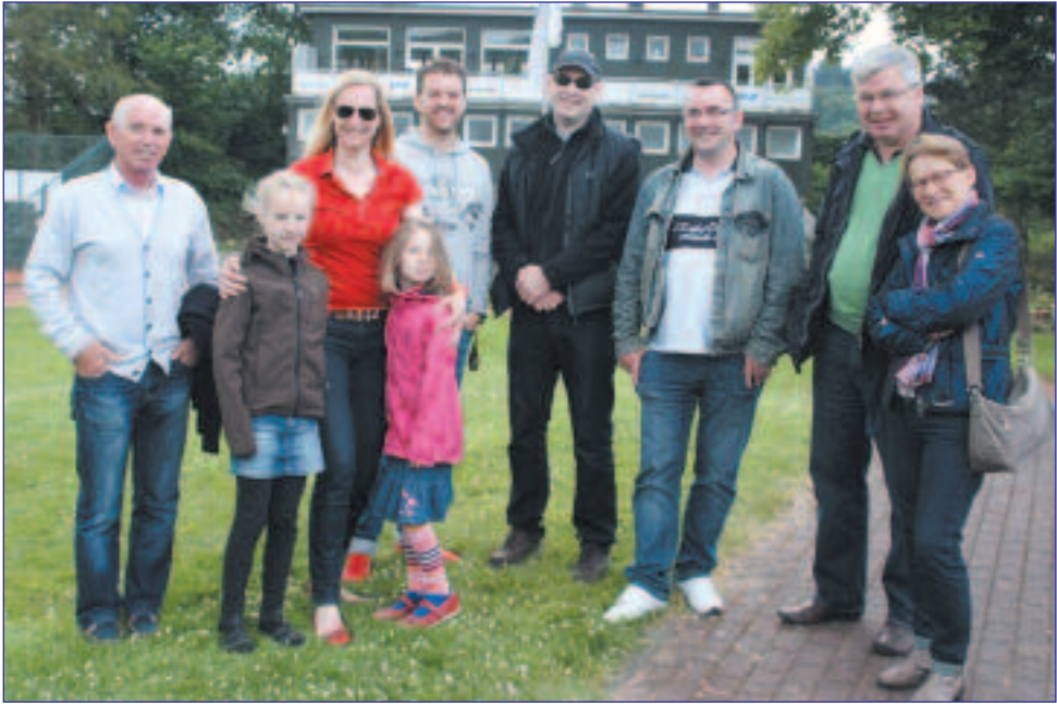
Eltern, Onkel, Geschwister, Trainerin und Jugendwart beim Spiel gegen ETUF III.