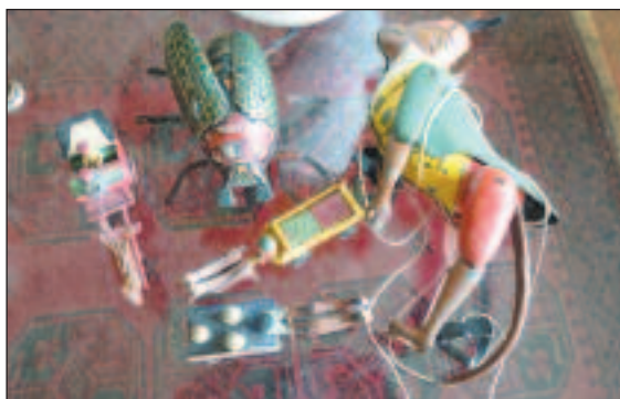
Maikäfer von EPL Lehmann um 1910, Kletteraffe von Lehmann, frühe Version mit aufgerauhter Jacke um 1900 und altes Spielzeug aus dem Erzgebirge um 1900.