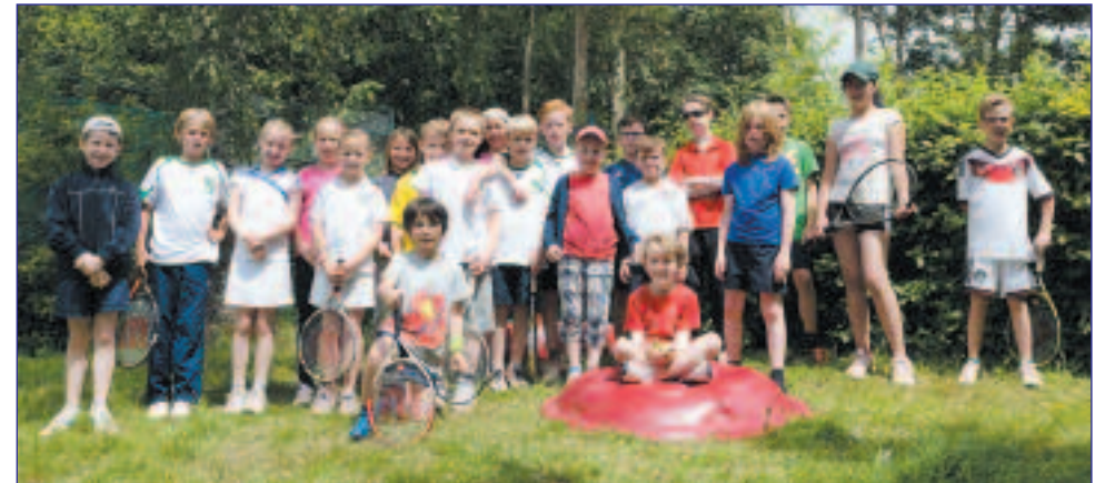
Die Teilnehmer unseres U10-Pokalturniers.