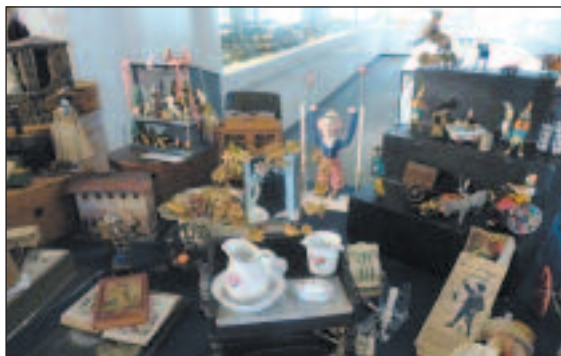
Spielzeugstand in Nürnberg am 8. März 2015 auf der Puppenbörse in Nürnberg im Spielzeugmuseum in Nürnberg.