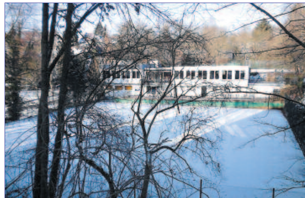
Unsere Anlage im Winterschlaf.

Auf CD eingereichte Beiträge sind besonders gut und rasch zu verarbeiten. Noch einfacher geht's per E-Mail an kdspiegel@arcor.de .