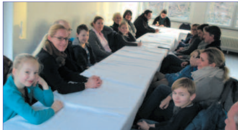
Teilnehmer unserer Jugendversammlung.

Unsere Spieler in den drei Mannschaften bekommen wieder ein vom Verein finanziertes Jugendfördertraining.