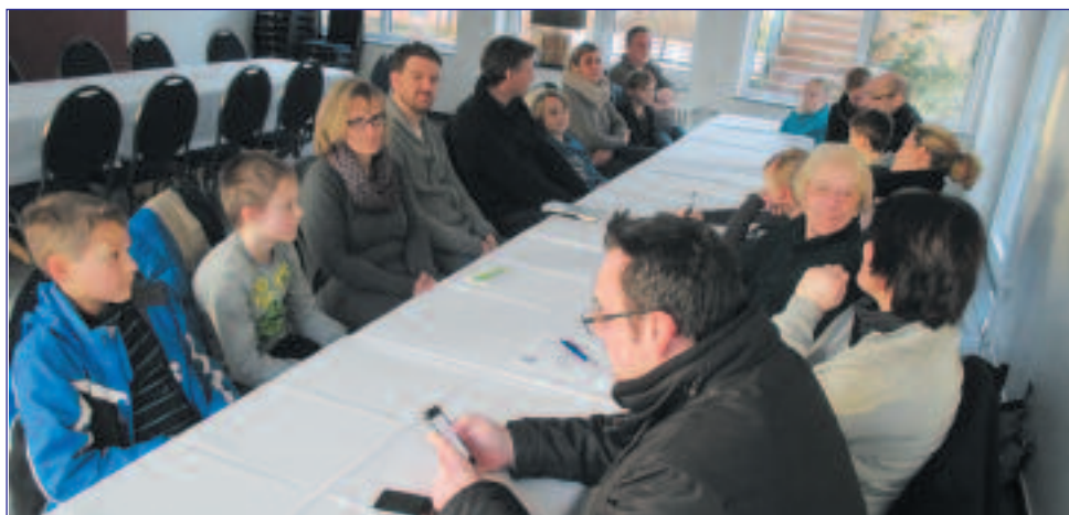
Teilnehmer unserer Jugendversammlung.