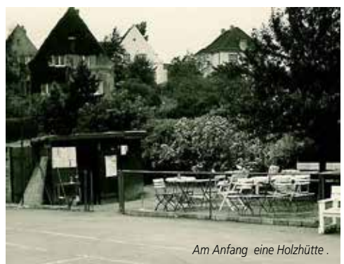
Am Anfang eine Holzütte.

70 Jahre PSV Tennisabteilung 1950 - 2020 Gefeiert wird nach der Corona-Pandemie im nächsten Jahr.