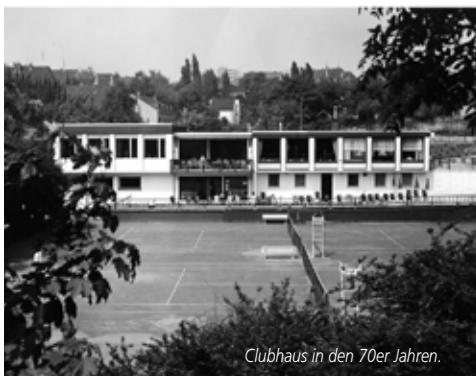
Clubhaus in den 70er Jahren.