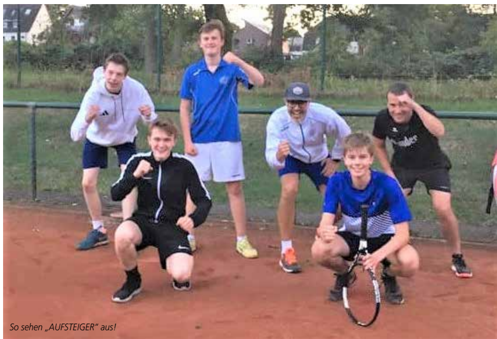
So sehen „AUFSTEIGER“ aus!